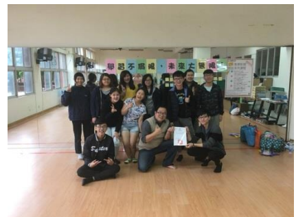
↑第四場培訓課程大合照