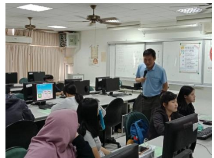
↑第三場培訓課程實景