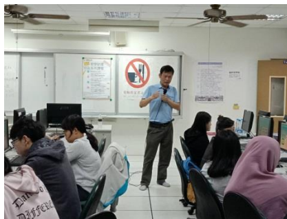
↑第三場培訓課程實景