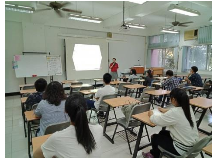
↑第一場培訓課程實景