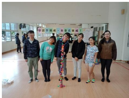
↑體驗式教育學生成果