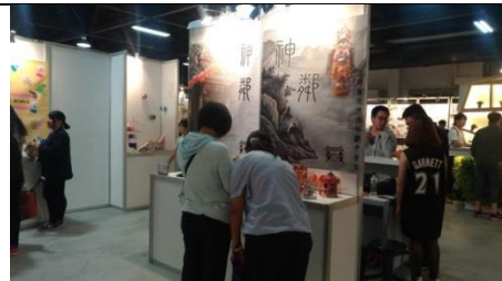
↑參觀者與解說人員。