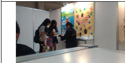
↑參觀者與解說人員。