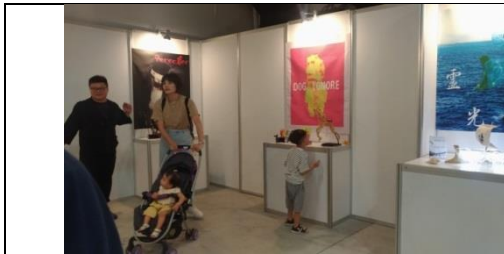
↑參觀者與解說人員。