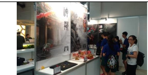
↑參觀者與解說人員。