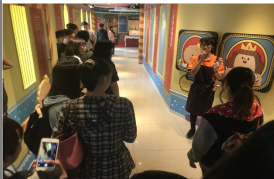
↑興麥蛋捲烘焙王國人員解說如何建置童話空間，並如何以故事行銷烘焙產品