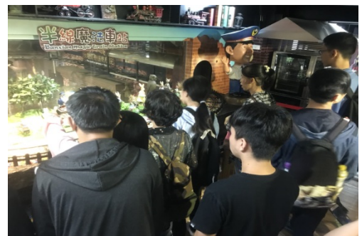
↑台灣優格餅乾學院建置繞園小火車行銷產品，圖為小火車所經半線魔法車站