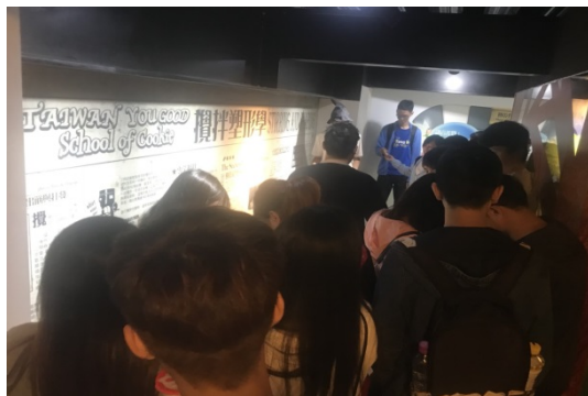
↑台灣優格餅乾學院導覽人員向學生解說餅乾攪拌塑型原理與製程