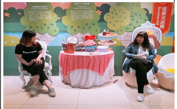
↑興麥蛋捲烘焙王國所建置甜蜜交誼廳以行銷產品，同學親身體驗情境氛圍。