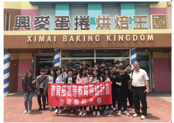
↑參訪興麥蛋捲烘焙王國團體合照