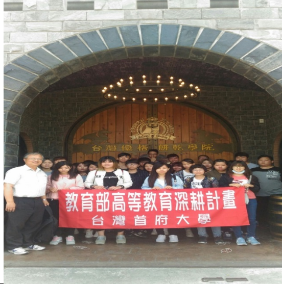
↑參訪台灣優格餅乾學院團體合照

的蛻變，並瞭解烘焙產業以及在地文化的結合之消費者目標市場之特性。本次參訪採分組討論及心得分享方式進行，學生普遍反應出參訪後，對於行銷的實務理念較有概念，也對本身行銷管理專業知能有所助益，並較能瞭解行銷之理論與實務上之差異性。於此，本次參訪初步培養出學生利於畢業銜接就業市場之能力，及提昇學生掌握未來烘焙產業發展趨勢與契機之能力等效益。