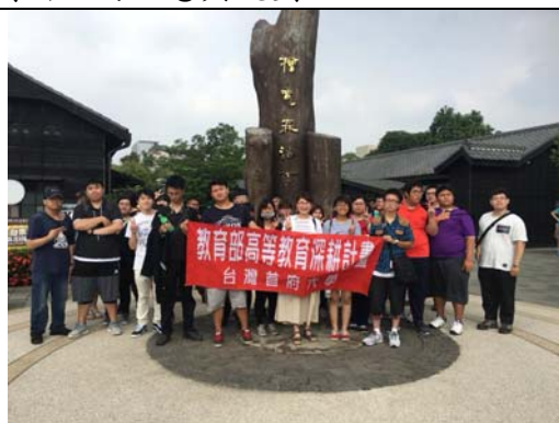
↑嘉義檜意森活村入口團體拍照