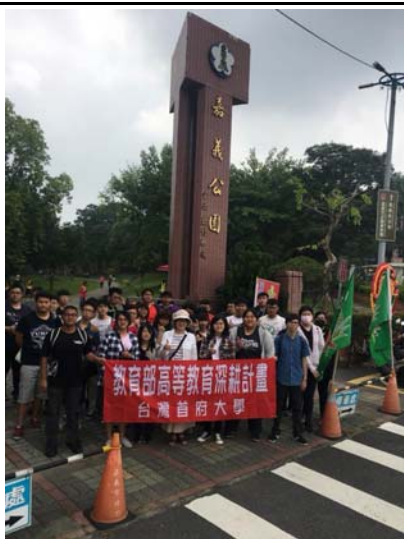
↑嘉義公園入口團體拍照