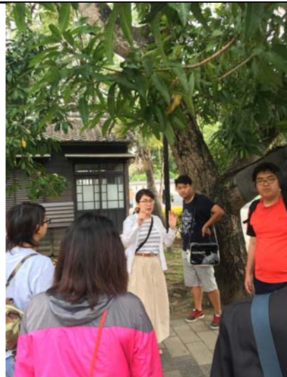
↑講述檜意森活村結合文創概念打造文創園區的理念與規劃