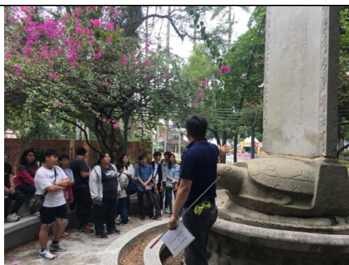
↑導覽公園內各時期的遺址