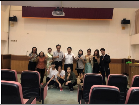
↑為了展現最好的自己，不斷重複的練習