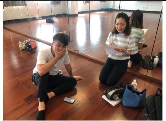
↑學姊一起來傳承經驗