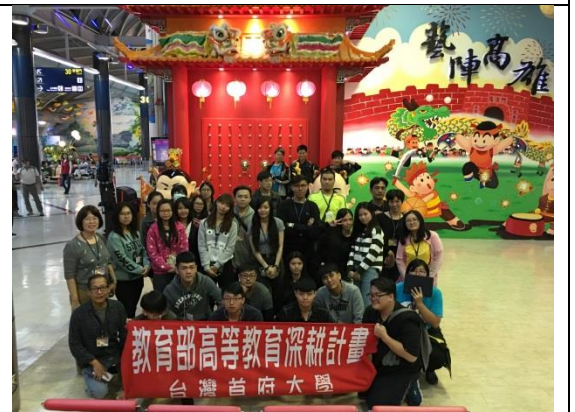
↑ 登機門前主題造景合影