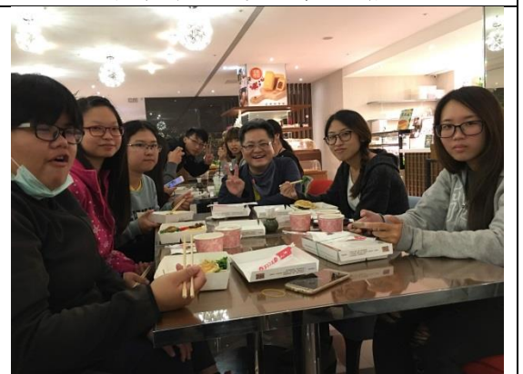
↑ 參訪後於高雄會館享用餐盒