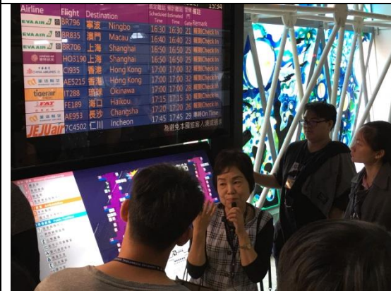
↑ 進入管制區後尋找登機門