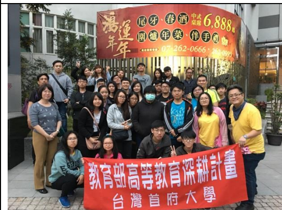
↑ 高雄國際會館前合影