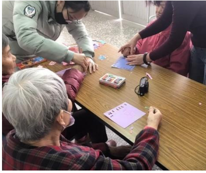
↑學生們牽著阿嬤的手一起作畫