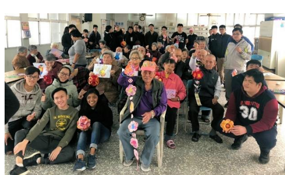
↑「一生平安」幸福彩球活動大合照