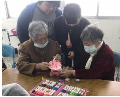
↑學生們協助阿嬤的彩球畫圖寫字