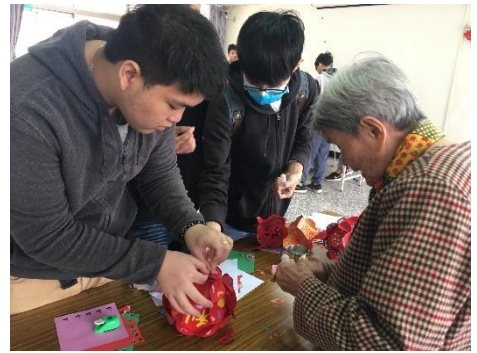
↑學生們協助阿嬤的彩球黏貼紙張